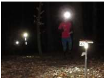
Vel mødt i mørket!

Instruktion og startliste vil kunne ses via menuen øverst til venstre før løbet. Når løbet er afholdt, vil du også kunne finde resultater og stræktider via menuen.