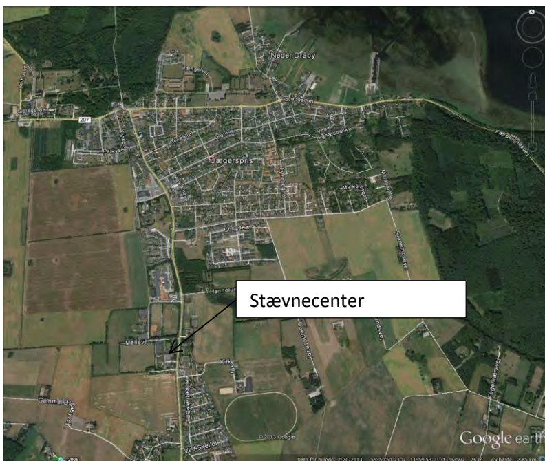
FIGUR 2 PLACERING AF STÆVNECENTER