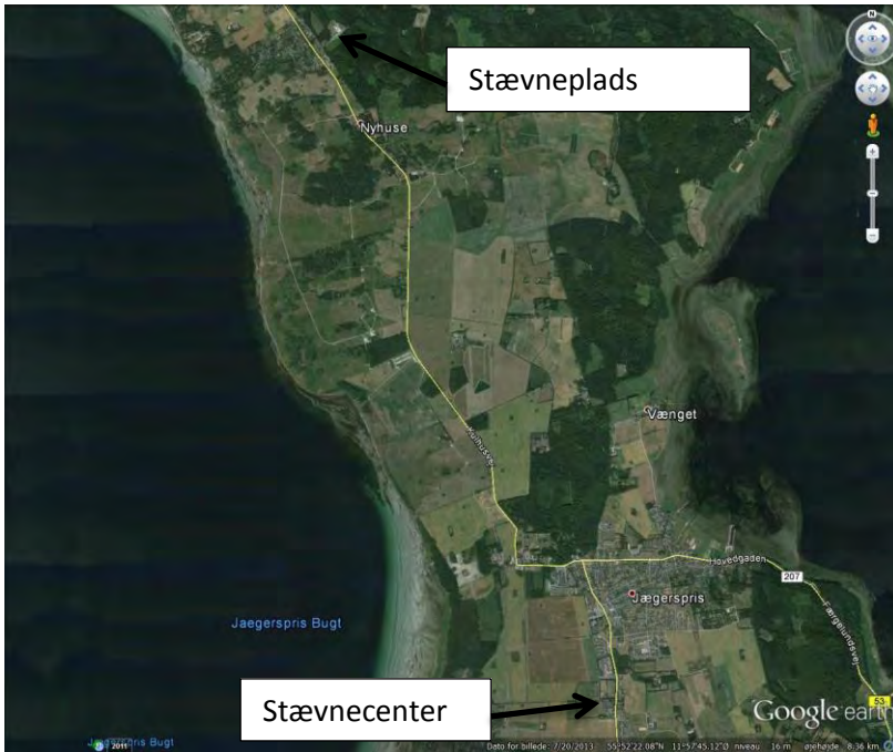
FIGUR 1 OVERSIGT JÆGERSPRIS MV.