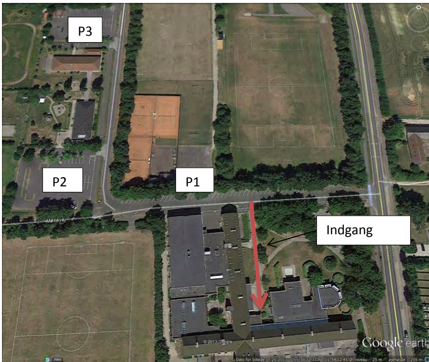
FIGUR 4 STÆVNECENTER, SOGNESKOLEN