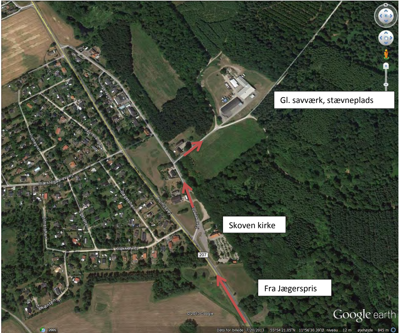
FIGUR 5 PLACERING AF STÆVNEPLADS